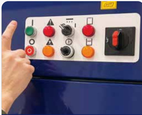
STEROWANIE PRZYJAZNE DLA UŻYTKOWNIKA