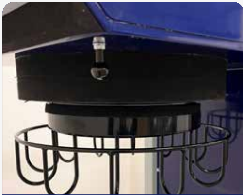
UCHWYT WORKA CIĄGŁEGO