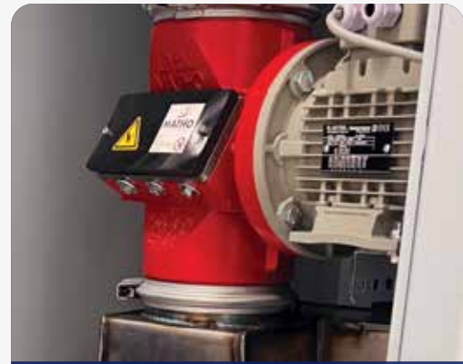
WEWNĄTRZ ZAINSTALOWANY MŁYNEK