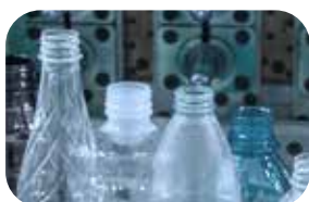
Formowanie z rozdmuchem