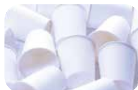
Produkcja kubków papierowych z EPS