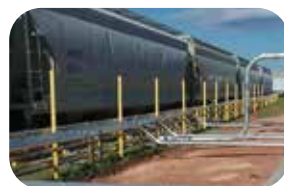
Rozładunki wagonów kolejowych