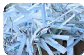
Przewijanie rolek z papierem