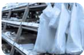
Produkcja opakowań elastycznych