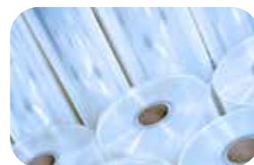
Przewijanie roli z tworzyw sztucznych