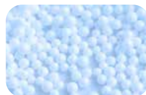
Opakowania ze spienionego PS i PE