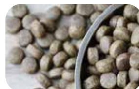
Produkcja karmy dla zwierząt domowych