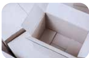
Produkcja opakowań tekturowych