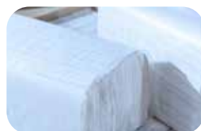
Produkcja materiałów higienicznych