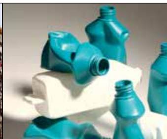
Wyroby gotowe i odrzuty do recyklingu.