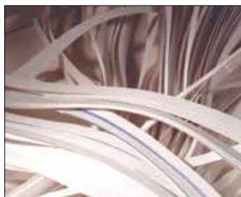
| Wstęgi ciągłe odpadów ze ścinków papieru i folii.