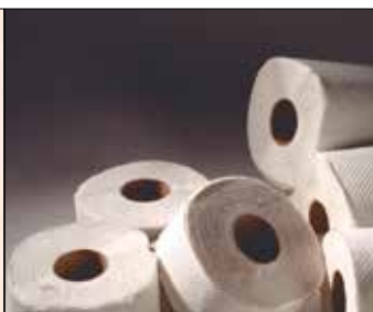
| Odpady z roli z produkcji artykułów higienicznych.