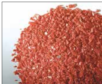
Recycling regranulowanych odpadów.

Firma Kongskilde specjalizuje się w transporcie, zagęszczaniu oraz oczyszczeniu odpadów produkcyjnych w przemyśle papierniczym, tworzyw sztucznych i opakowaniowym, w ten sposób umożliwiając Państwa firmie bezpośredni dostęp do prohandlowego know-how dotyczącego zarządzania odpadami przemysłowymi.