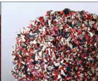
Odpady po procesie przetworzenia w płatkę.